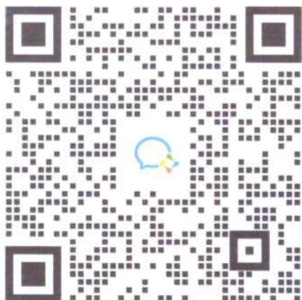
非金属材料培训群